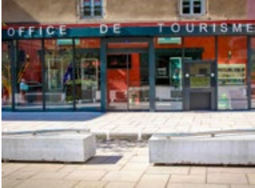
Office de Tourisme de Mâcon 1 place Saint-Pierre - 71000 Mâcon