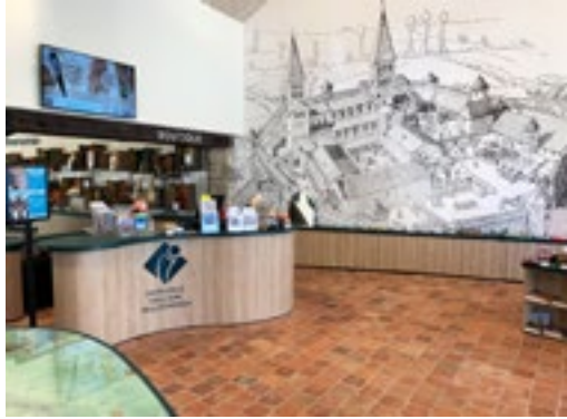
Office de Tourisme de Tournus 3 rue Gabriel Jeanton - 71700 Tournus

2 relais d'information touristique intégrés